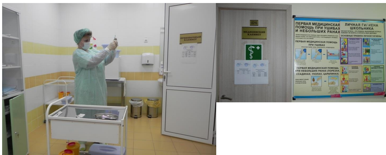
Оформлены уголки охраны труда, информационные стенды.

Во всех образовательных учреждениях, входящих в состав ГБОУ Школы № 2083, оборудованы медицинские кабинеты, оснащенные установками для обеззараживания воздуха.